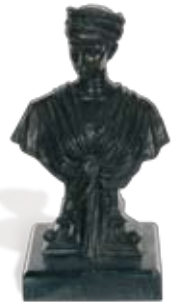
Auch nach ihrem Tod zeigen die meisten Skulpturen eine ewig jugendliche Sissi.

Wie sollen die Meraner ihre Kaiserin auch erkennen, wenn sie ohne Prunk und ohne Symbole der Macht vorfährt. Die Zeitungen schwärmen vom »blühenden Liebreiz« der jetzt 33-jährigen Elisabeth von Österreich. Ihr geht der Ruf außergewöhnlicher Schönheit voraus. Doch wie sie wirklich aussieht, wissen die wenigsten. In Tirol war sie noch nie. Selbst im Zentrum von Wien kann sie, wie sie ihrem Sohn Rudolf nach einem kurzen Abstecher von Meran in die Hauptstadt schreiben wird, in unauffälliger Kleidung mit ihrem Hund »jeden Tag auf der uneleganten Ringstraße spazieren, und die Leute kennen uns gar nicht, das ist sehr