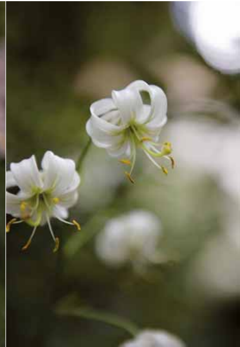
↑ Herbst-Anemone 'Honorine Jobert', Roter Fingerhut, Astilbe, Türkenbund-Lilie ↓ In einer kleinen Arena trennen Buchsbaumzeilen die Zuschauerreihen.